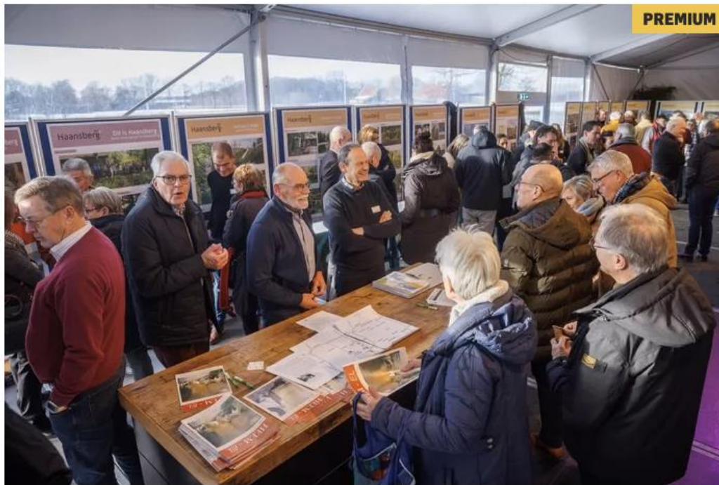
▲ Honderden mensen zijn afgekomen op de bijeenkomst 'De visie op Haansberg', over een nieuwe wijk in Etten-Leur.