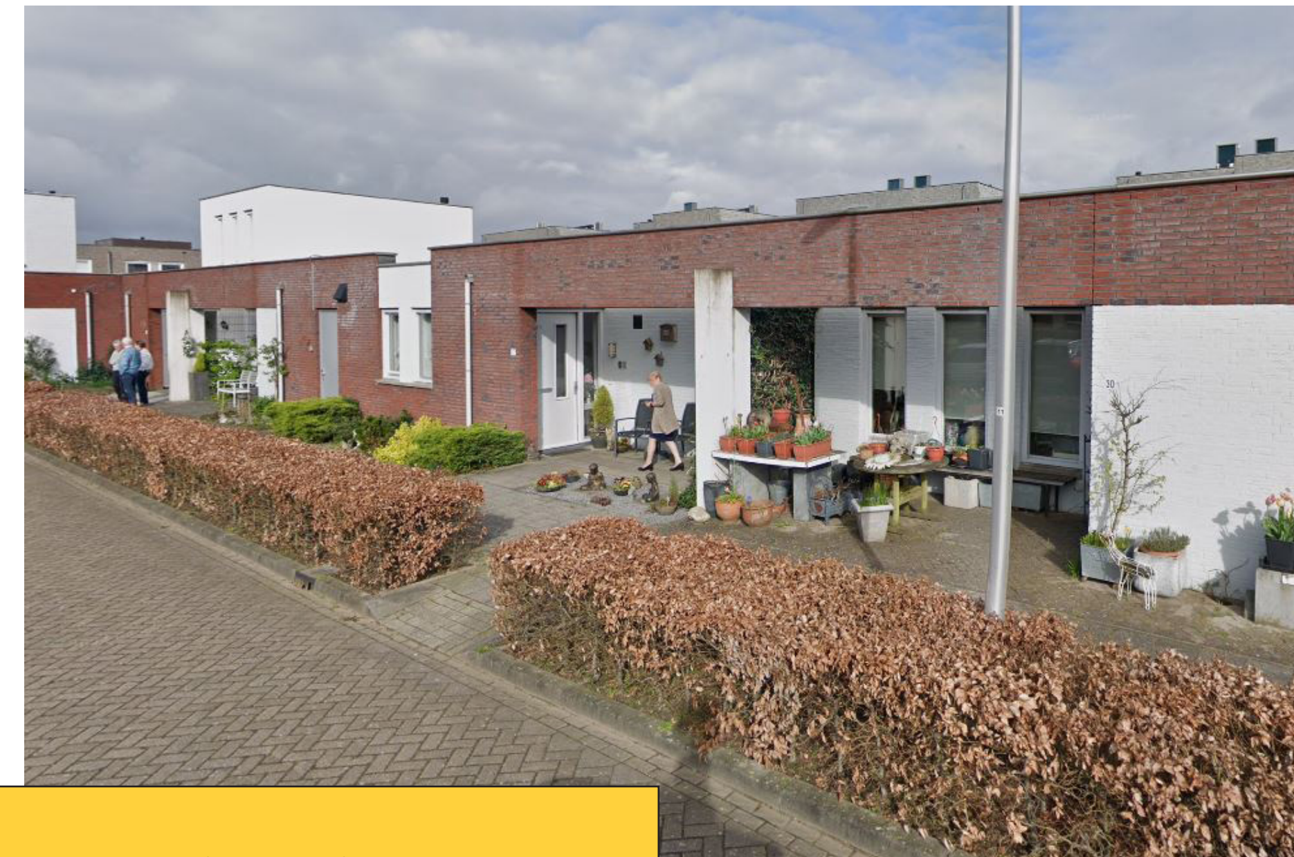
1 laag met of zonder kap