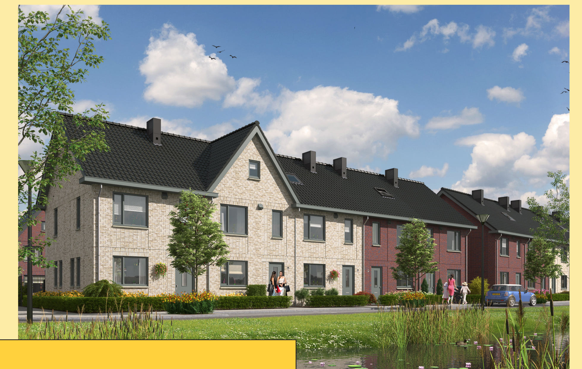
2 lagen met kap