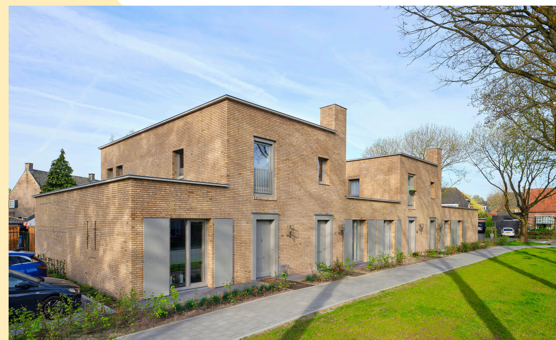
2 lagen zonder kap